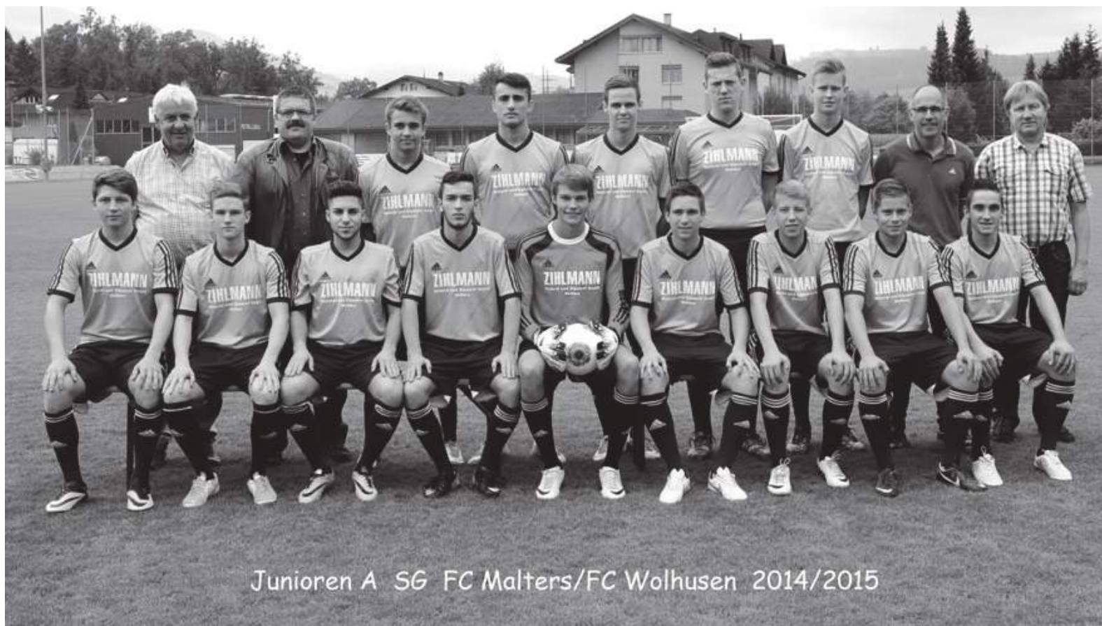
Juniores A SG FC Malters/FC Wolhusen 2014/2015

Ein tolles Frühstücksbuffet erwartete uns im Frühstücksraum. Eier, Fleisch, Käse, Müesli, Früchte, Joghurt, Fruchtsäfte, Tee und Kaffee, diverse Brote etc. alles was das Herz begehrt. Die