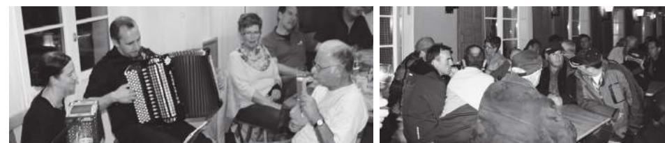
D' Husmusig vom Lamm, Menznau Wandergruppe endlich im Trockenen vor dem Apéro